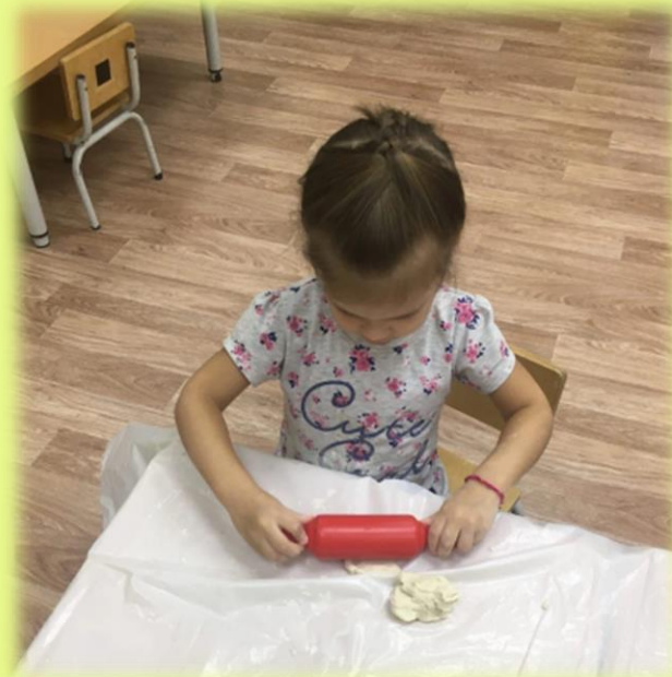
Игры с тестом из муки и соли